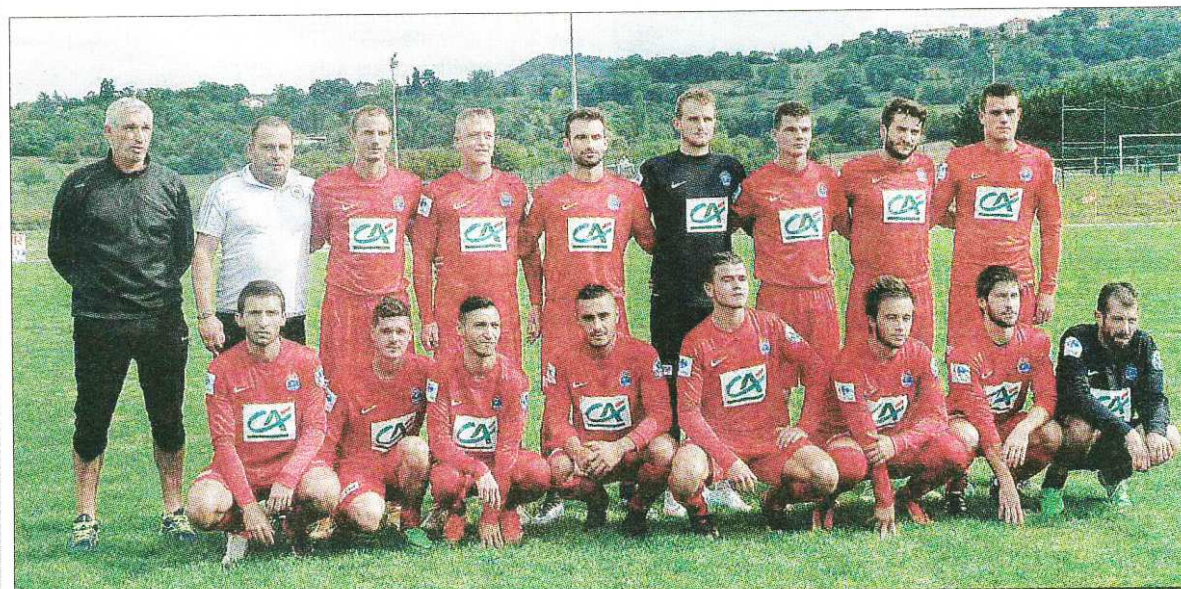
COUPE DE FRANCE. Les seniors terminent leur parcours en Coupe de France sur un match de qualité contre Vichy, deux divisions au dessus.

Coupe de France : si près d'un joli coup, les Vicomtois entament le match tambour battant et dominent Vichy.