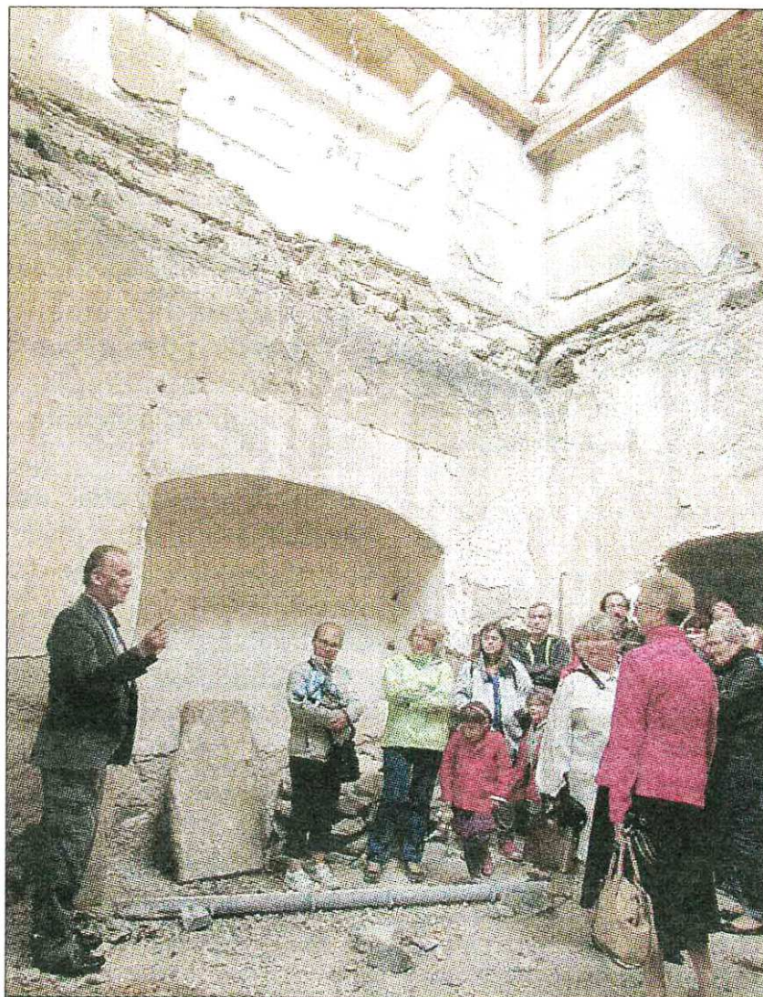
PATRIMOINE. Guidés dans le monument et dans l'histoire, le public replonge dans le passé glorieux du château, rêvant de sa future jeunesse.

La Chaux Folie's, organisatrice de cet événement proposait également un marché artisanal et de producteurs locaux, qui était malheureusement réduit compte tenu des con-